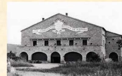
1947 Création de la cave coopérative

Les années 30 Mise en place de la mixité dans les deux classes de l'école publique Début du bitumage de nos routes.